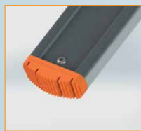
Leiterfuß 70 mm