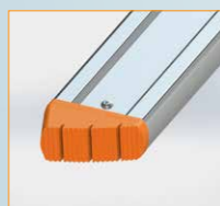
Leiterfuß 86 mm schräg 2504-51 re -52 li