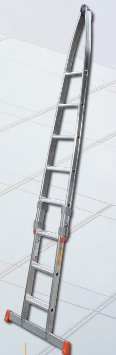
159-05 mit -63